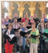
Coral de Ruada Desde 1918 ha ejercido una labor de "conservación de la tradición y la cultura" a través de la música