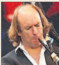
Carlos Núñez El gaitero comparte el galardón de la Xunta con la banda irlandesa The Chieftains