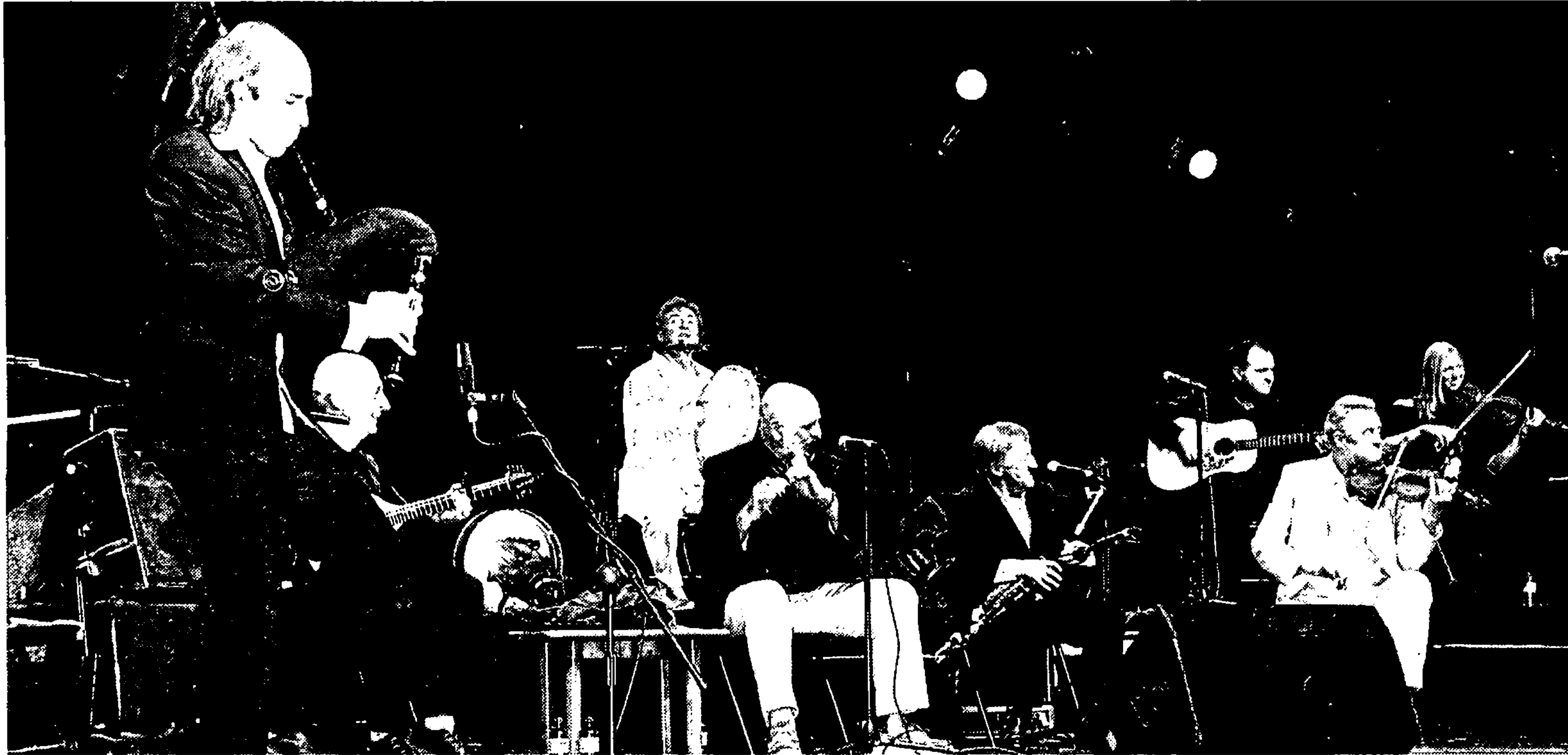
Carlos Núñez, en una de las actuaciones que protagonizó con la banda The Chieftains.