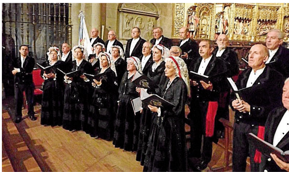
La Coral de Ruada recibirá en junio la distinción de la Medalla Castelaos después de más de nueve décadas de actividad que la han convertido en una institución