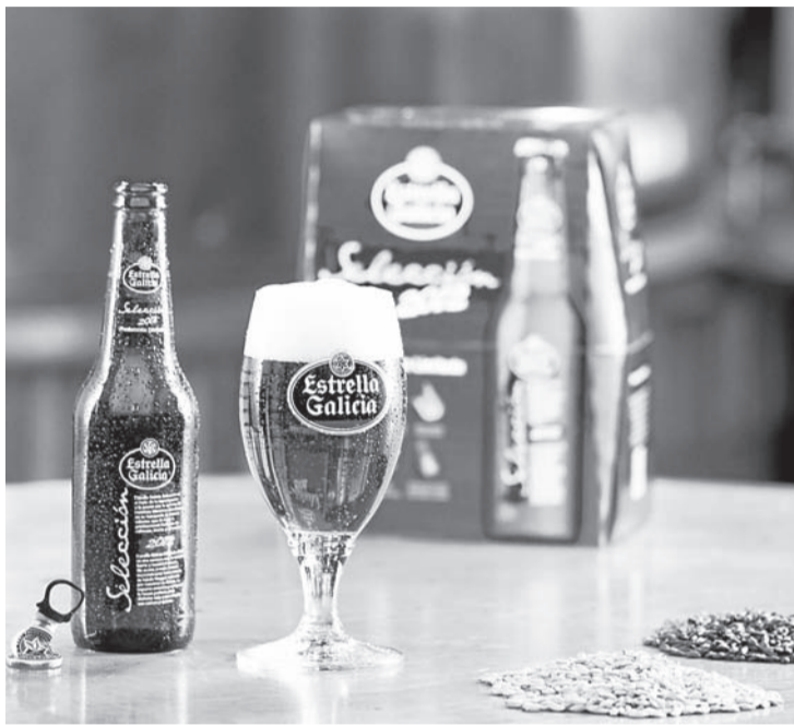
La cervecera gana el premio por fomentar el emprendimiento de Galicia

Tras más de 107 años de historia, cuatro generaciones de la familia Rivera ha logrado situar Estrella Galicia entre las principales marcas del ámbito español y con una más que significativa actividad exportadora, que se traduce en su presencia en más